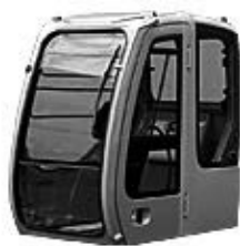
建設機械用キャブ