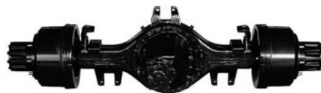
アクスルユニット